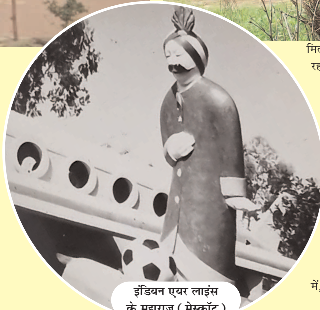
इंडियन एयर लाइंस के महाराज ( मैस्कॉट )

सन् 1974 में बोर्ड कॉलोनी, रवि शंकर नगर के पार्क में कुछ आकृतियां बनाई गई थी इनमें क्रॉस , स्ट्रेट और राउंड स्लोप के साथ, आकर्षण का केंद्र सीमेंट का हवाई जहाज भी बनाया गया था . इस हवाई जहाज के बगल में इंडियन एयरलाइंस के महाराज ( मैस्कॉट ) की मूर्ति भी बनाई गई थी .