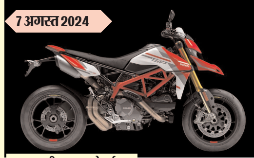
डुकाटी हाइपरमोटार्ड 950 एसपी कीमत रुपए 19.05 लाख