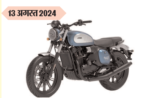
अपरेटेड जावा 42 कीमत : रुपए 1.73 लाख