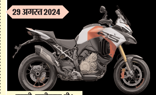
डुकाटी मल्टीस्ट्राडा वी4 आरएस कीमत : रुपए 38.40 लाख