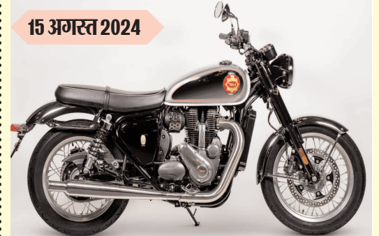
बीएसए गोल्ड स्टार कीमत : रुपए 3.00 लाख