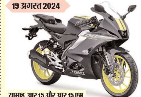
यामाह आर 15 और आर 15 एम नए रंग में कीमत : 2.08 लाख