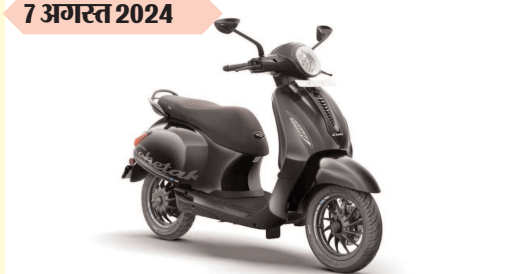
बजाज चेतक 3201 कीमत : रुपए 1.29 लाख