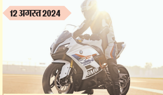
बीएमडब्ल्यू जी 310 आर आर नया रंग कीमत : 3.05 लाख