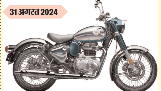
रॉयल एनफील्ड क्लासिक 350 कीमत : रुपए 2.00 लाख