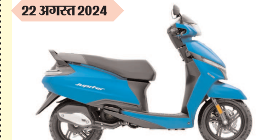
टीवीएस जूपिटर 110 कीमत : रुपए 73 हजार 7 सौ