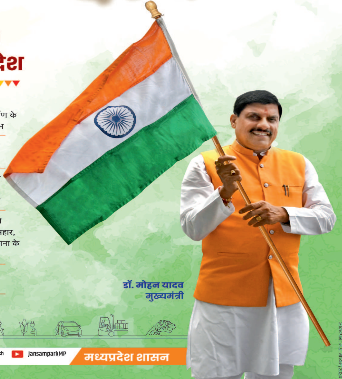
डॉ. मोहन यादव मुख्यमंत्री

मुख्यमंत्री किसान कल्याण योजना में 83 लाख से अधिक किसानों को ₹14254 करोड़ की सहायता