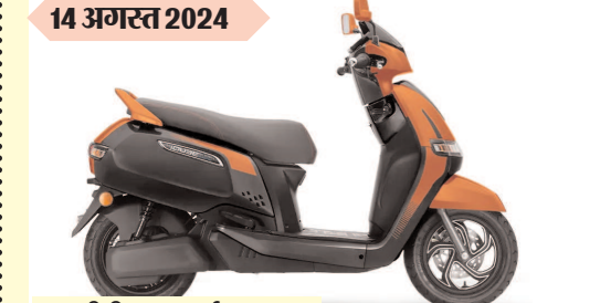
टीवीएस आई वय्व सेलिब्रेशन एडिशन कीमत: रुपए 1.20 लाख