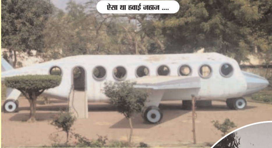
ऐसा था हवाई जहाज ....