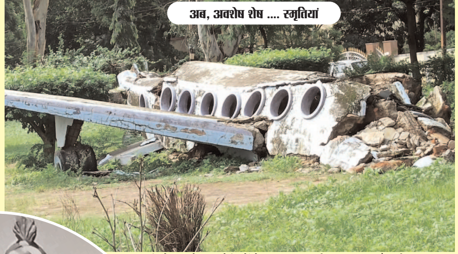
अब, अवशेष शेष .... स्मृतियां