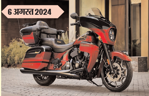
इंडियन रोडमास्टर इलाइट कीमत : रुपए 71.82 लाख