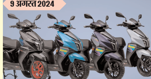
टीवीएस एन टॉर्क 125 रंगों की नई श्रृंखला में