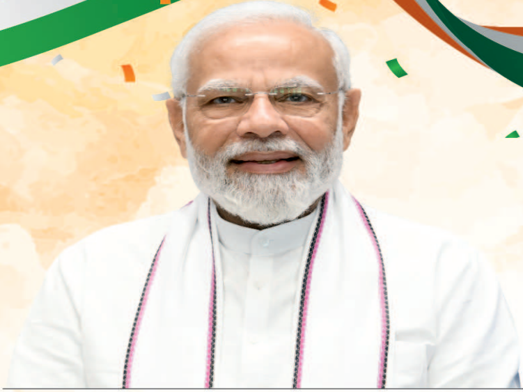
नरेन्द्र मोदी, प्रधानमंत्री

78 वें स्वतंत्रता दिवस की हार्दिक शुभकामनाएं